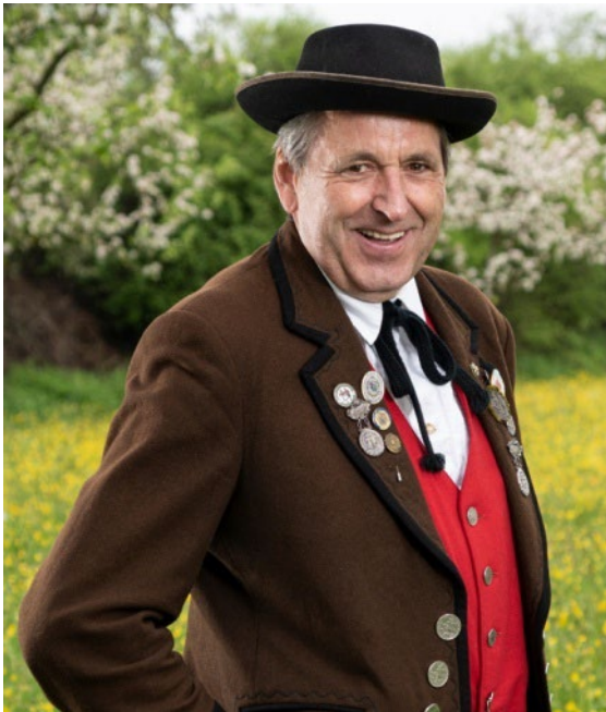
Jugendleiter des Trachtenvereins Massing