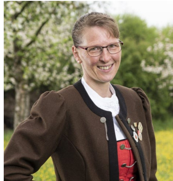
Jugendleiterin des Trachtenvereins Massing